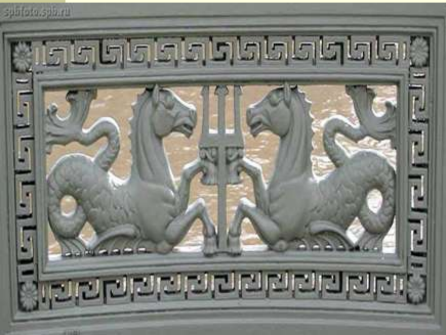
Ограда Аничкова моста