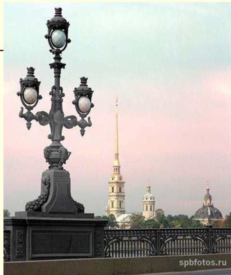
Фонарь и ограда Троицкого моста